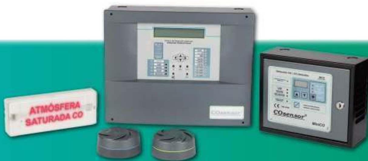
Sistema de detección de Monóxido de Carbono (CO)